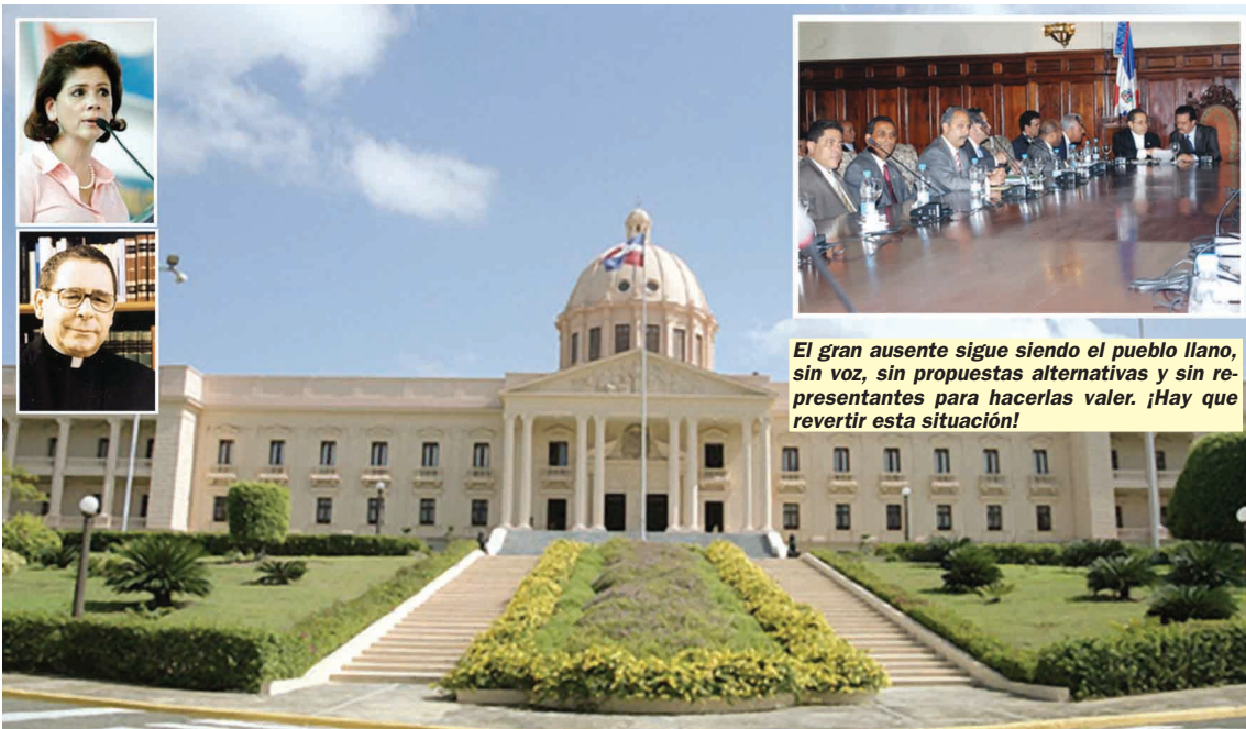
El gran ausente sigue siendo el pueblo llano, sin voz, sin propuestas alternativas y sin representantes para hacerlas valer. ¡Hay que revertir esta situación!

La inminente entrada en vigencia del DR-CAFTA, el funesto acuerdo comercial impuesto al país, activó la búsqueda de consenso para la reforma fiscal.